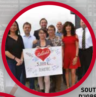
SOUTIEN D'IGRETEC AU TÉLÉVIE