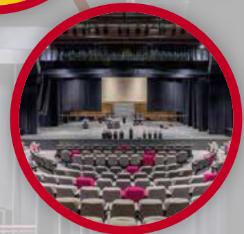
THÉÂTRE DE SAMBREVILLE SAMBREVILLE