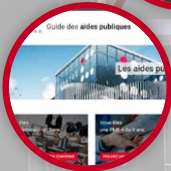
GUIDE DES AIDES PUBLIQUES ON-LINE