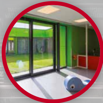
CRÈCHE BEL AIR ÉCAUSSINNES