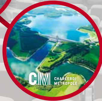
IDENTITÉ GRAPHIQUE CHARLEROI MÉTROPOLE