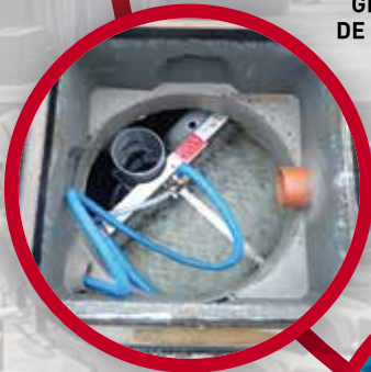
GESTION PUBLIQUE DE L'ASSAINISSEMENT AUTONOME