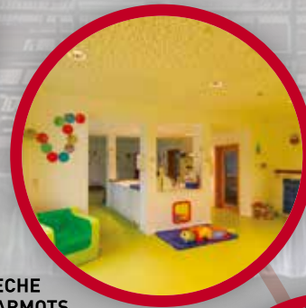
CRÈCHE LES MARMOTS LES BONS VILLERS