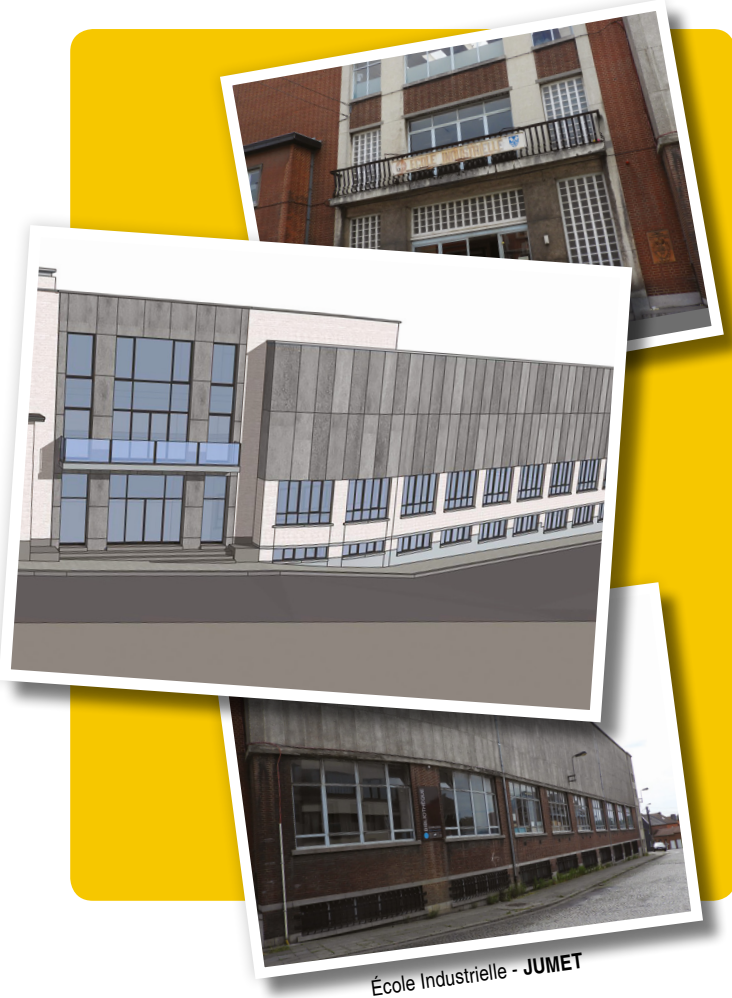
École Industrielle - JUMET

rejoint cet objectif, ce qui permettra d'atteindre des niveaux de performance conformes aux exigences de la Ville. 45 millions d'euros de levier financier, hors subsides, sont disponibles pour réaliser les rénovations énergétiques. Les bâtiments seront rénovés de façon globale, avec des interventions sur l'enveloppe, la ventilation, les systèmes de chauffage, le relighting et la possibilité de recourir au photovoltaïque. La problématique de la lutte contre la surchauffe estivale sera prise en compte, de même que des mises en conformité seront réalisées, le cas échéant.