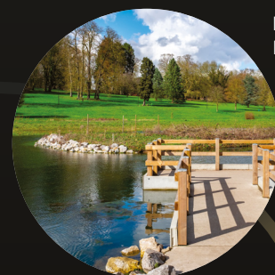
Bureau d'Études Pôle Eau et Espaces Publics