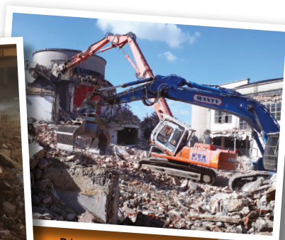
Démolition du Palais des Expositions