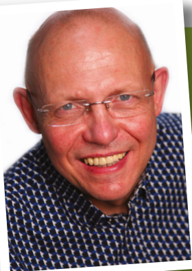
CLAUDY DEMAREZ BOURGEMESTRE DE CHIÈVRES