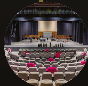
Bureau d'Études Pôle Bâtiment