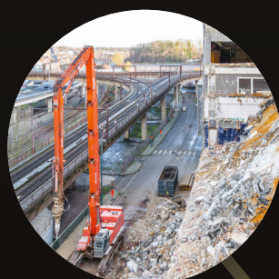
Assistance Maîtrise d'Ouvrage