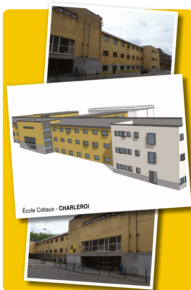
École Cobaux - CHARLEROI

L'ensemble des mesures préconisées par le Bureau d'Études d'IGRETEC