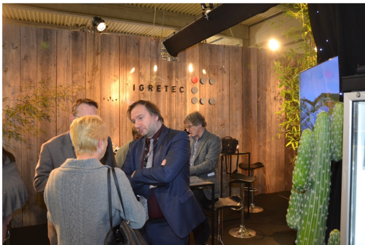
Salon des mandataires 2018