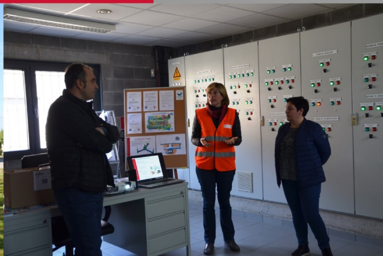
Journées wallonnes de l'Eau à Ham-sur-Heure