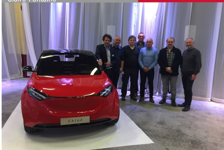
Reconversion du site de Caterpillar