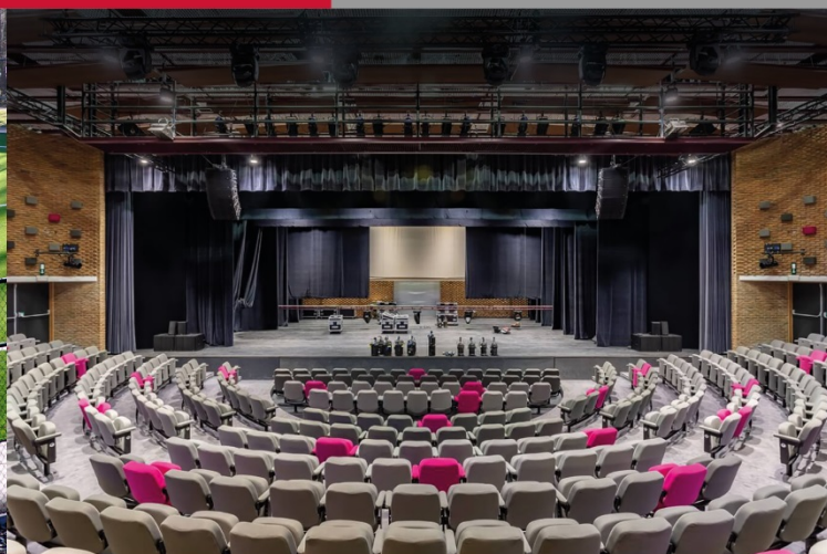
Théâtre de Sambreville