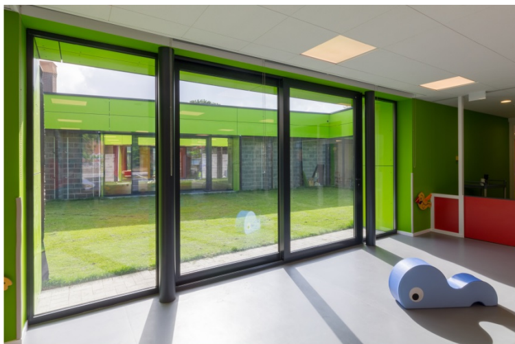
Crèche Bel Air à Ecaussinnes