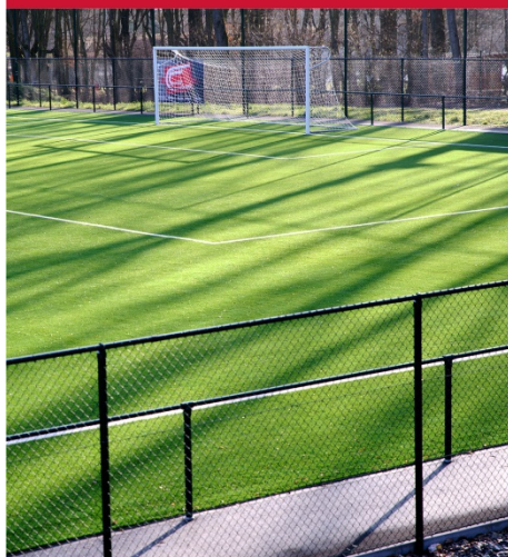
Complexe footballistique de Claire-Fontaine