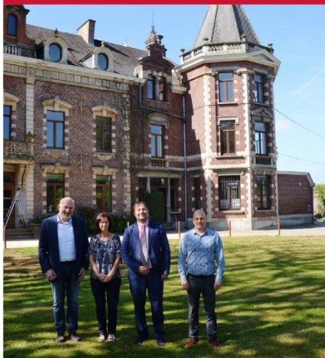
Inauguration de la crèche Le Château des Marmots