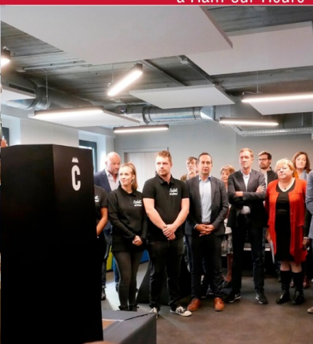
Inauguration Auberge de Jeunesse de Charleroi